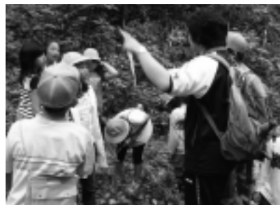
産卵数調査の様子