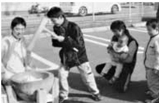
昨年ついたもちが120臼にもなりました