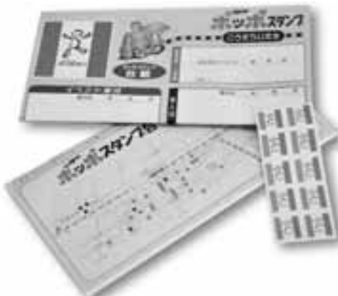
その昔走った汽車の「ポップ」という音からその名になりました

今年で始めて16年目になるポップスタンプ。スタンプは、加盟店で買い物をすると100円ごとに1枚もらえ、それを台紙に350枚張って1冊分貯まると、加盟店や協力店で500円の金券として利用できます。ほかのスタンプカードと違うのは、指定の金融機関に持っていくと1冊で500円の預金が可能なこと。こうした利用法も、商店街で購入した人が使いやすいようにと、組合の皆さんが地元の金融機関と交渉を重ねた成果です。また、ホテル食事券や野球観戦券との引き換えなど月ごとにさまざまなイベントも実施しています。この引き換えができる店舗は交代制となっていて、普段訪れない店にも入ってもらうことで、良さを知ってもらえる良い機会になっています。こうした取り組みを続けてきたことで、ポップスタンプは地域の皆さんに、しっかりと定着しています。