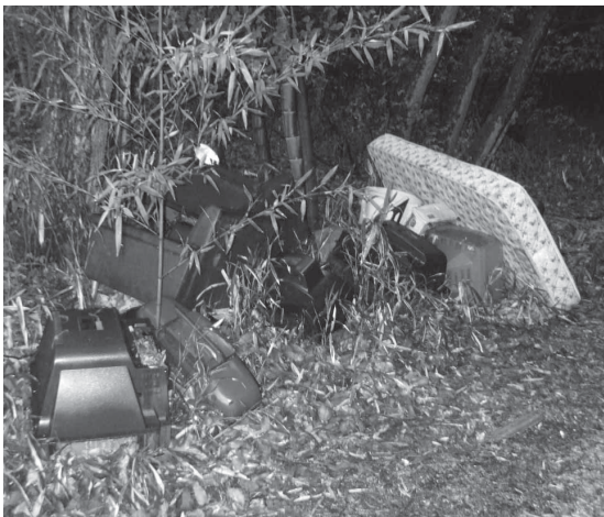
市内の不法投棄現場

近年、心無い人たちによる不法投棄が社会問題となっており、残念なことに市内においても各所で見受けられます。違法に捨てられたごみは、街の景観を損なうばかりでなく、市民生活にも影響を及ぼす恐れがあります。きれいな街を守るため、みんなで不法投棄をなくしましょう。