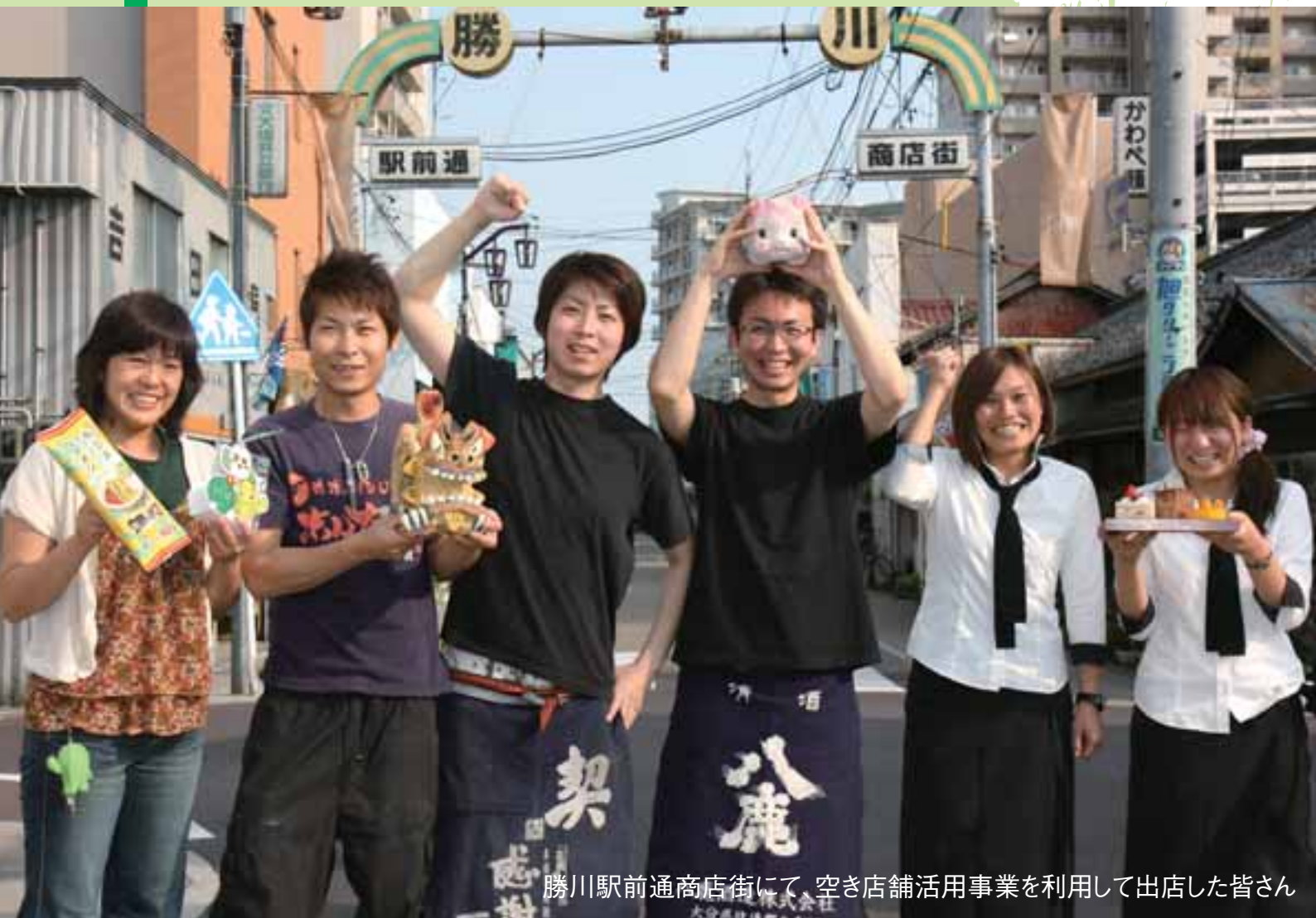
勝川駅前通商店街にて、空き店舗活用事業を利用して出店した皆さん