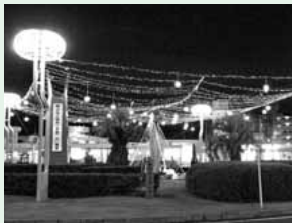
約1万3000個の電球が駅前を飾ります

今後はイルミネーションを華やかにしたり、野菜の数を増やしたりして、駅を利用する人の足を止めたいと商店会の人たちの意気は上がっています。