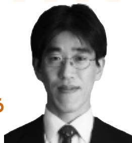
慶応義塾大学大学院 メディアデザイン研究科 教授・岸博幸

申し込み▶10月20日(木)午前9時から電話で、春日井商 工会議所内、法人会事務局(☎81-4141)へ