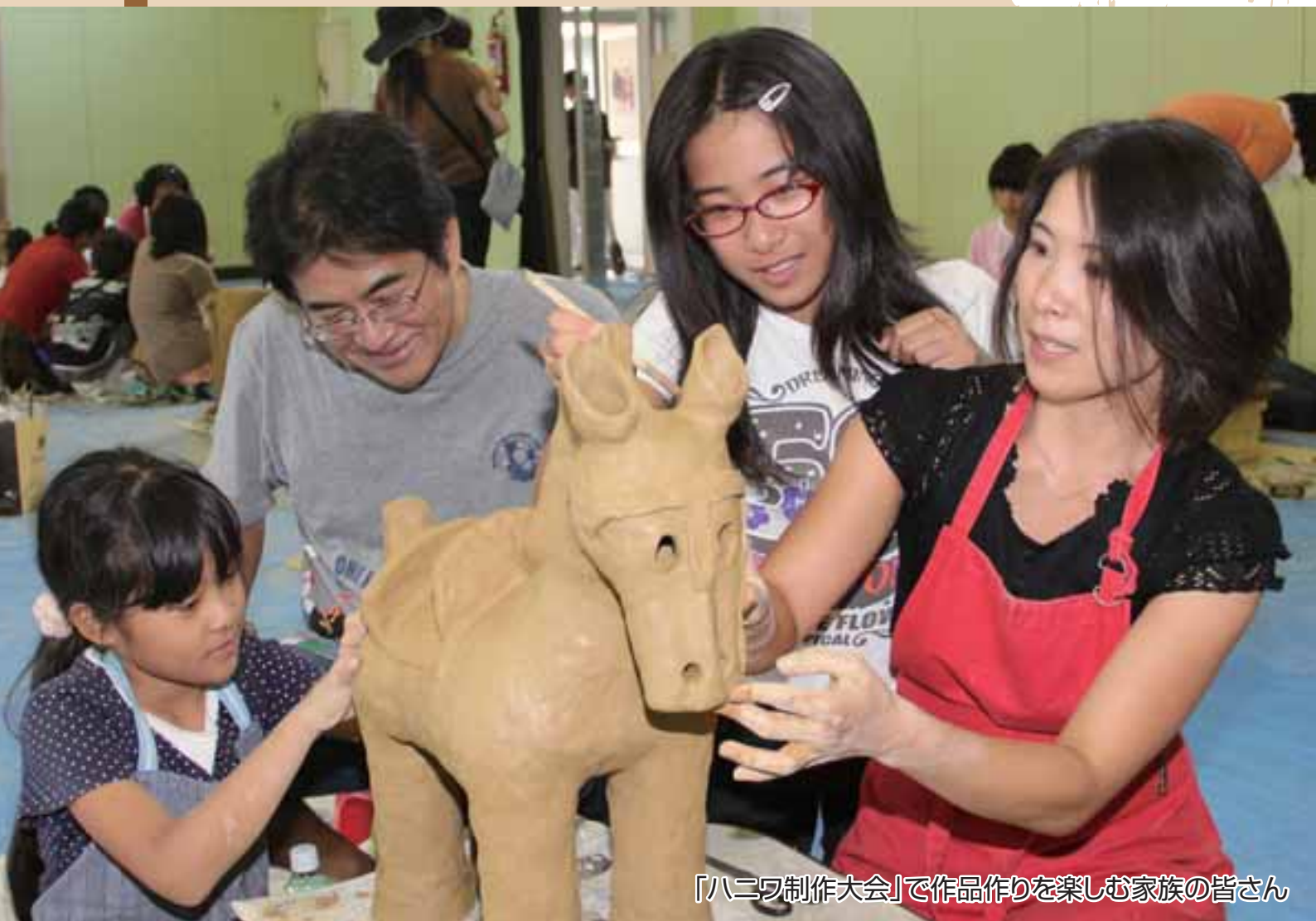
「ハニワ制作大会」で作品作りを楽しむ家族の皆さん