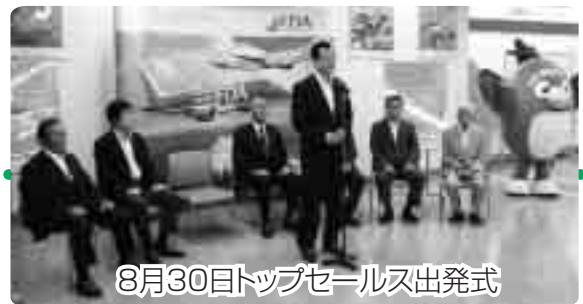
8月30日トップセールス出発式

撤退するという事態となり、民間路線が全て無くなるという状況でしたが、フジドリームエアラインズ(FDA)が就航してくれることとなり、現在は、福岡、熊本、いわて花巻、青森の4路線を運航しています。