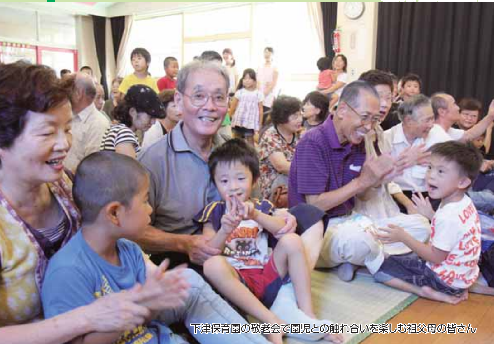
下津保育園の敬老会で園児との触れ合いを楽しむ祖父母の皆さん