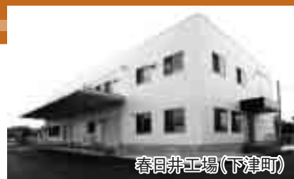
春日井工場(下津町)

経営方針である「顧客の期待を上回る製品と信頼を提供する」を達成するとともに、よき企業市民として社会の発展に貢献できる企業を目指しています。