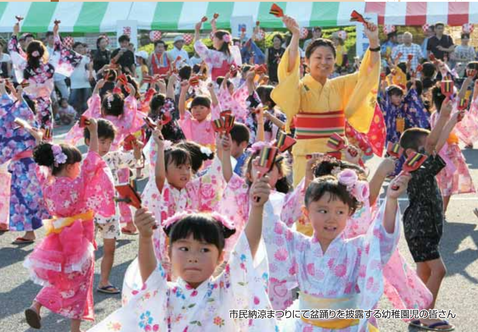
市民納涼まつりにて盆踊りを披露する幼稚園児の皆さん