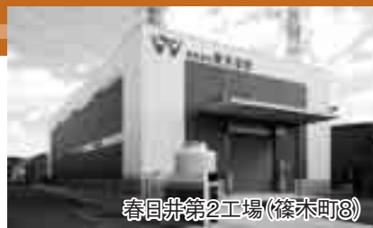
春日井第2工場(篠木町8)

特許権などの産業財産権を400以上保有しています。「固定概念を捨て一味違う発想」を合言葉に、社会のニーズに機敏に対応し、時代の変化を先取りして、広く社会に貢献できる企業を目指しています。