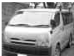
特に被害の多い200系ハイエース