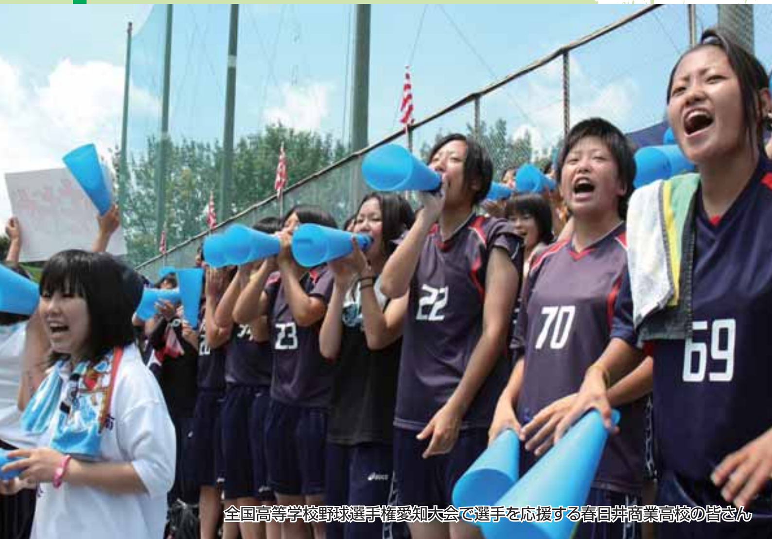
全国高等学校野球選手権愛知大会で選手を応援する春日井商業高校の皆さん