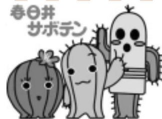
春代 日丸 井之介

春日井サボテンプロジェクトホームページ http://www.kcci.or.jp/saboten-pj/