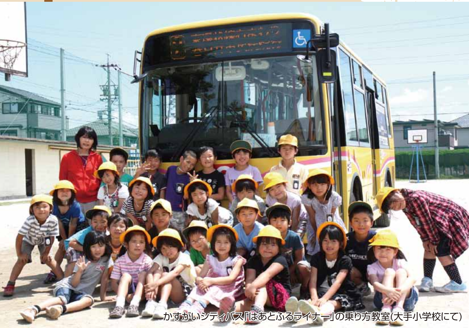
かすがいシティバス「はあとふるライナー」の乗り方教室(大手小学校にて)