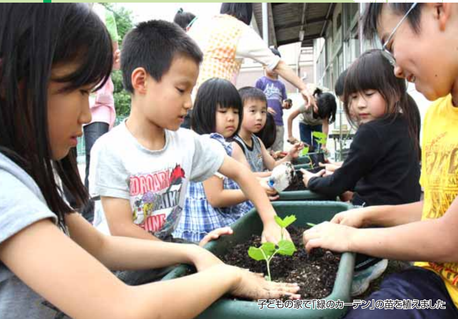
子どもの家で「緑のカーテン」の苗を植えました