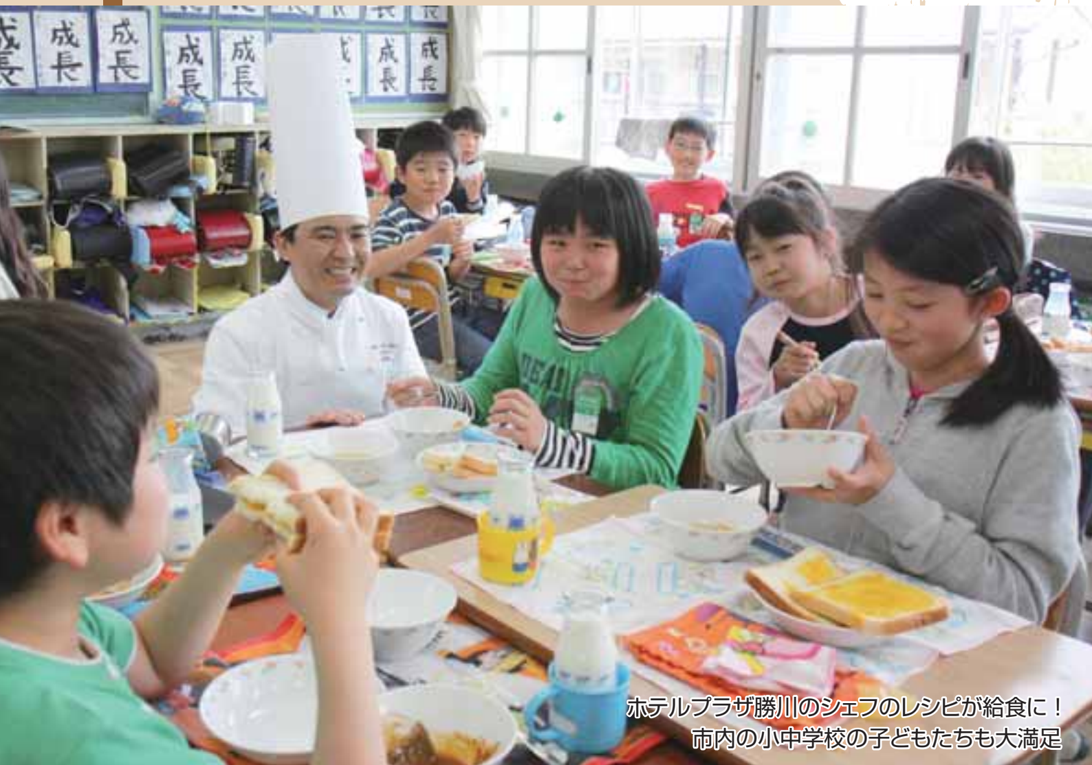
ホテルプラザ勝川のシェフのレシピが給食に！ 市内の小中学校の子どもたちも大満足