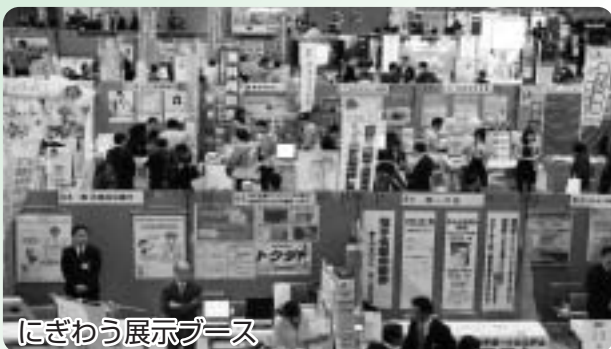
にぎわう展示ブース

市内外の企業95社110ブースが出展した「かすがい発見ビジネスフォーラム」が2日間に渡って行われ、各ブースでは自社一押しの技術や製品を意欲的にPRしていました。また、マッチングスペースでは出展企業の担当者らが真剣な表情で商談を交わしていました。初日には併催事業としてパナソニックエコシステムズ(株)と(有)後藤サボテンを見学する産業観光も行われました。