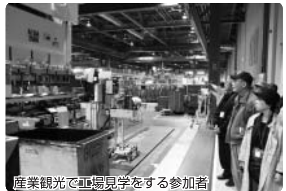
産業観光で工場見学をする参加者