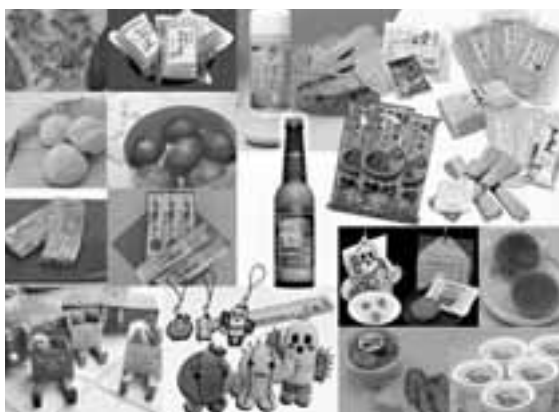
さまざまなサポテン関連商品

いう300人ほどの集落があります。その集落は行政に頼らず、住民総出で知恵を出し合って地域再生に取り組んでいて、子どもが「おはよう」と声を掛けると、みんなが「おはよう」と返してくる、そんなほのぼのとした集落だそうです。春日井も市役所に行けば明るい雰囲気、商工会議所へ行けば