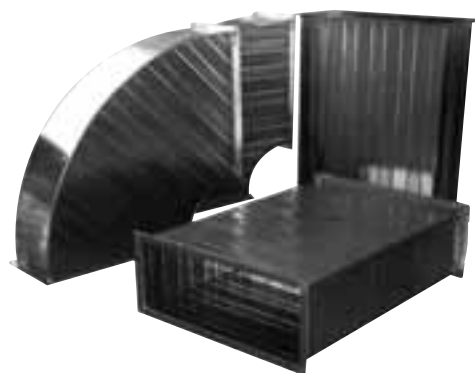
空調ダクト「ラインエコ」

現在、新規事業「アロマエアー」のアロマオイルとディフューザー(噴霧器)の販売を行うなど、新たな事業にも挑戦しています。