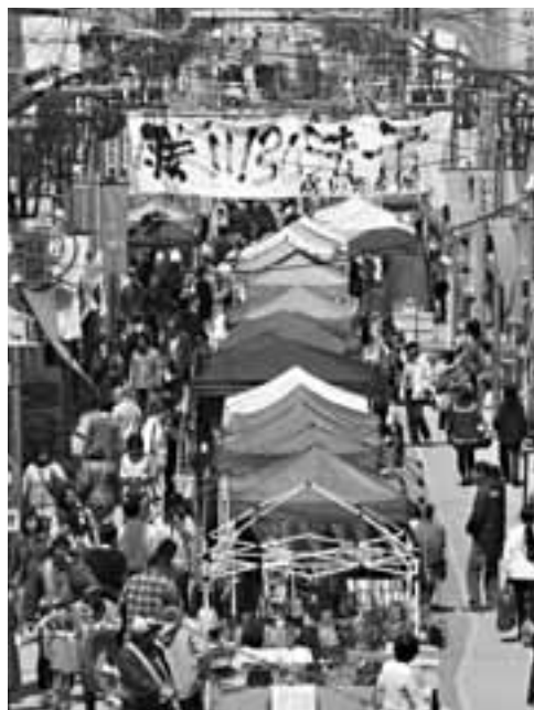
第3土曜日に開かれている勝川弘法市

市長 勝川地区では、第3土曜日に弘法市が開催されています。鳥居松地区でも昨年「とりいまつにぎやかマルシェ」が開かれるようになりました。例えば、第1土曜日は高蔵寺地区で、第2土曜日は鳥居松地区で、第3土曜日に開かれている勝川弘法市