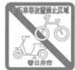
※自転車等放置禁止区域の標識