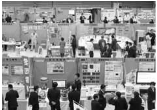
昨年の「かすがい発見ビジネスフォーラム」

会頭 2月4日・5日に総合体育館で「かすがい発見ビジネスフォーラム」を開催しますが、これも回