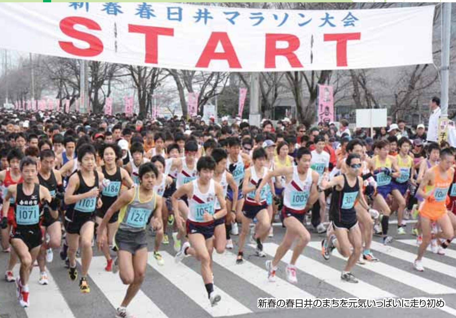
新春の春日井のまちを元気いっぱい走り初め