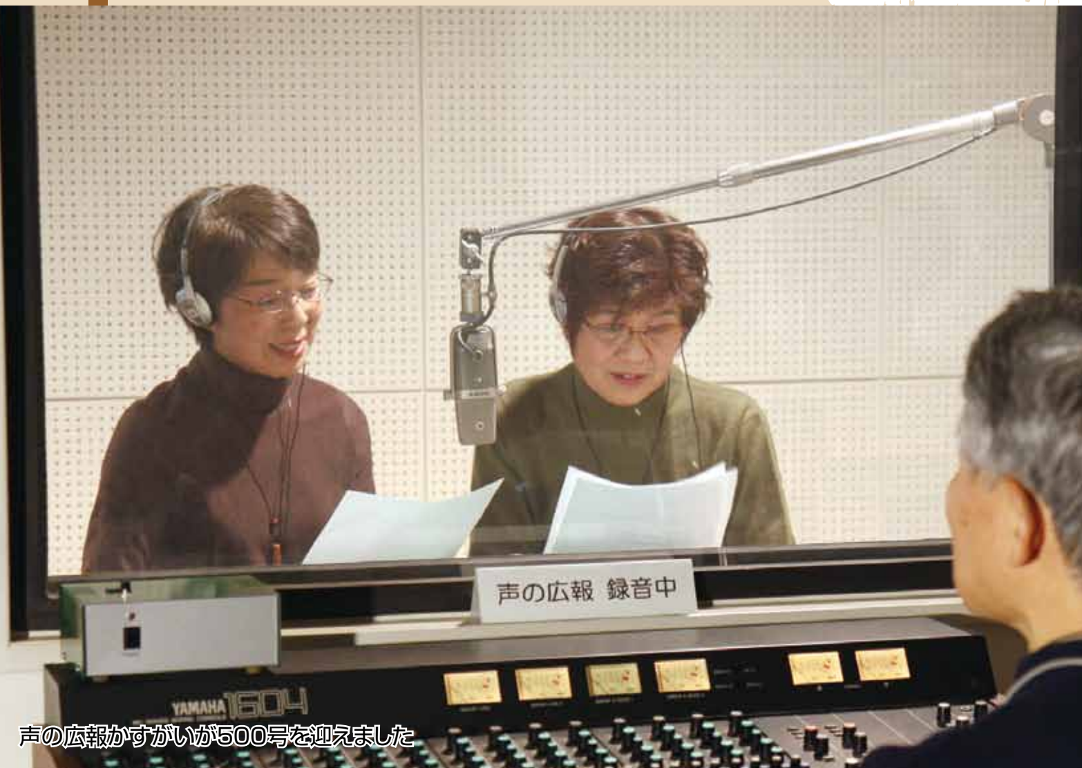
声の広報かすがいが500号を迎えました