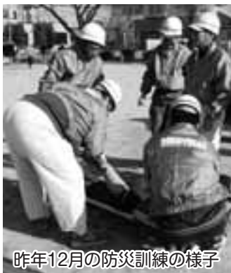
昨年12月の防災訓練の様子

六軒屋町では、芸能などの各種団体の活動が盛んです。そこで、災害時に、公民館や公園に地域の災害対策本部を設置した際、町内連合会長や各町内会長などの町内会の役員だけではなく、 クラブや同好会などの各種団体を本部員に定め 、それぞれ役割を決めて活動することにしました。また、 地域内の事業所 や医師、看護師、介護福祉士、建築士、アマチュア無線免許取得者などの 特殊技能を持つ住民に、災害復旧への協力を依頼 しています。どちらも、町内のいろいろな人が災害時に協力し合えるように日ごろから意識してもらうことが重要だと考えています。