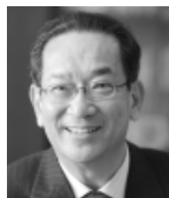
早稲田大学大学院教授 北川正恭

とき▶1月24日(月)午後3時~4時30分 ところ▶ホテルプラザ勝川 定員▶250人(先着順) 申し込み▶春日井商工会議所(☎81-4141)へ 共催▶春日井市