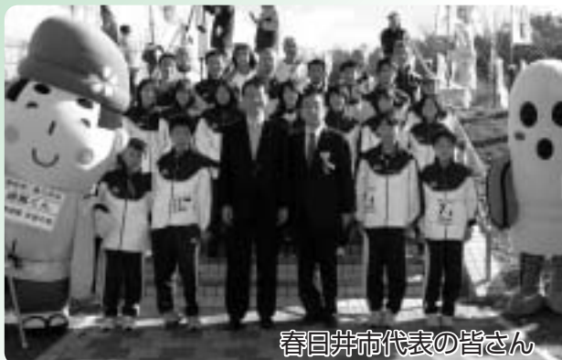
春日井市代表の皆さん