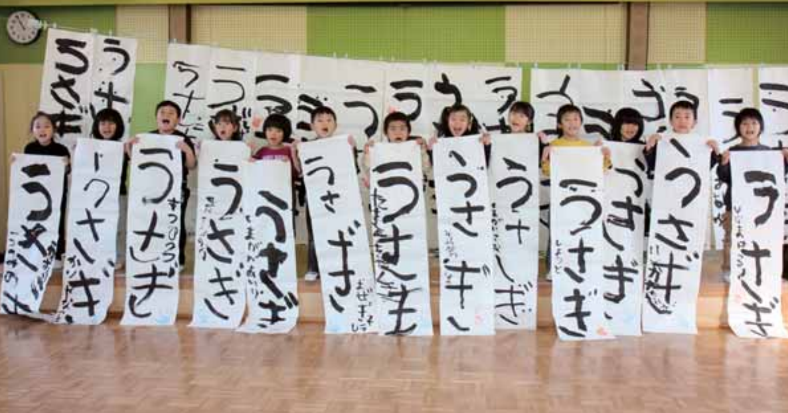
第二保育園の園児が大きな筆と紙で干支(えと)のうさぎに挑戦(あ〜とふるマイタウン事業)