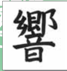
春日井市議会議長 水谷 忠成