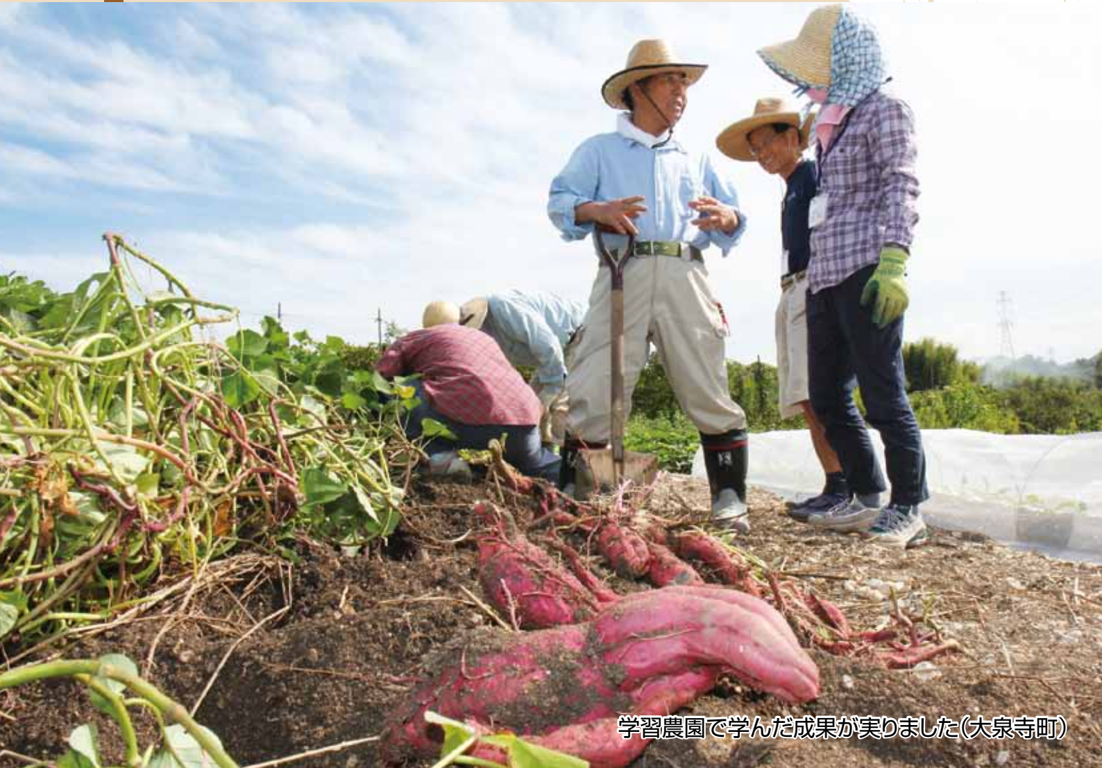
学習農園で学んだ成果が実りました(大泉寺町)