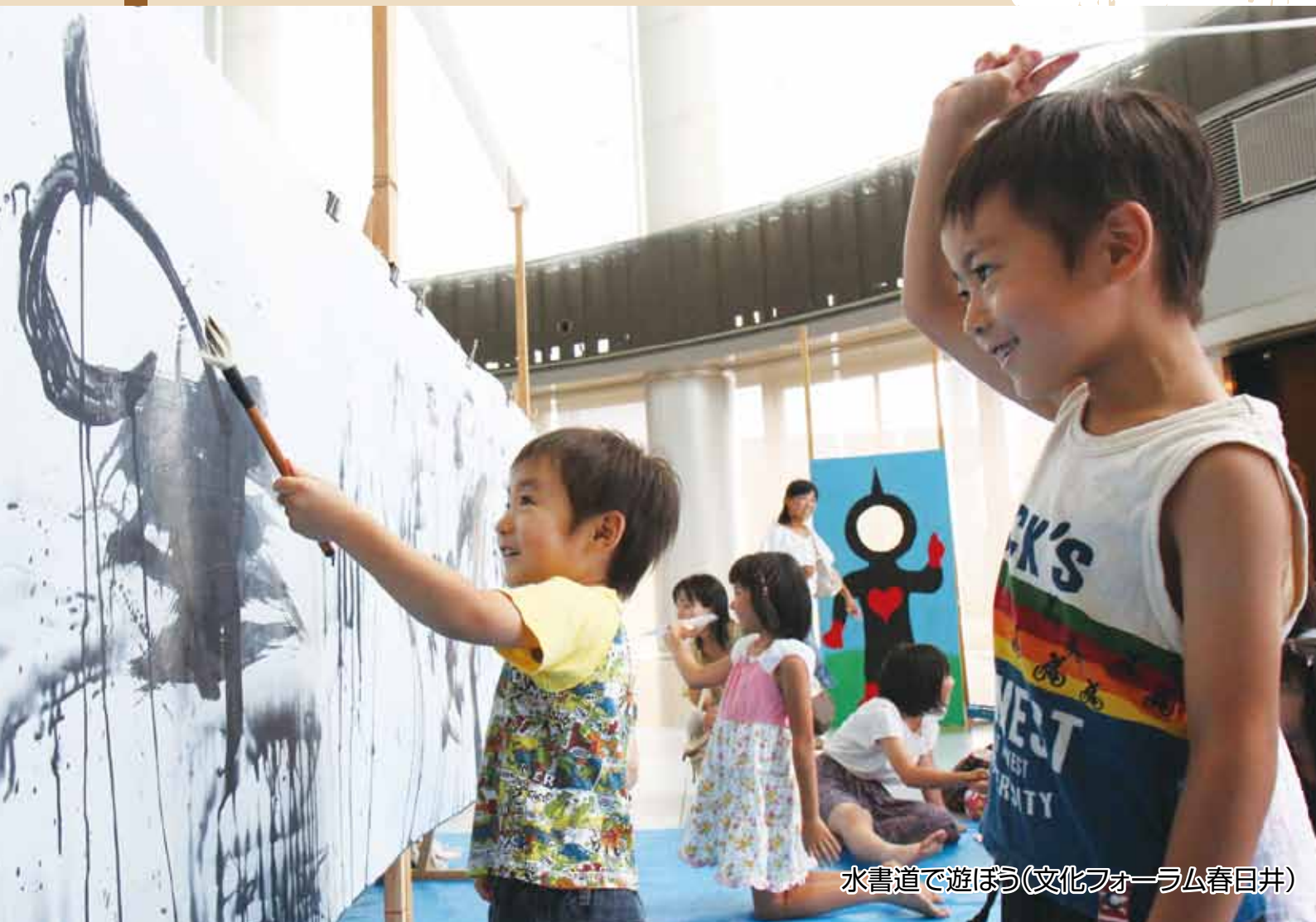
水書道で遊ぼう(文化フォーラム春日井)