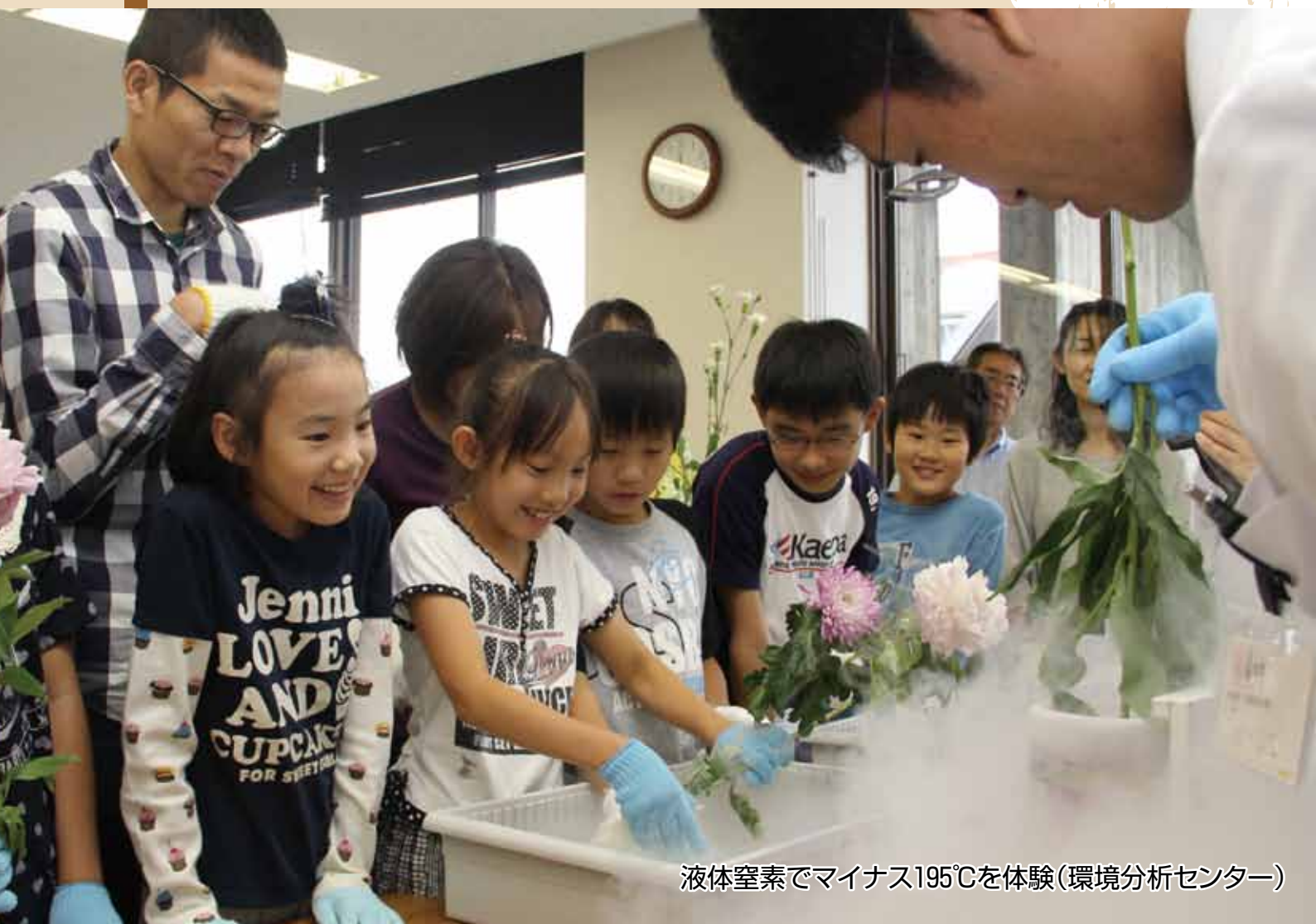
液体窒素でマイナス195℃を体験(環境分析センター)