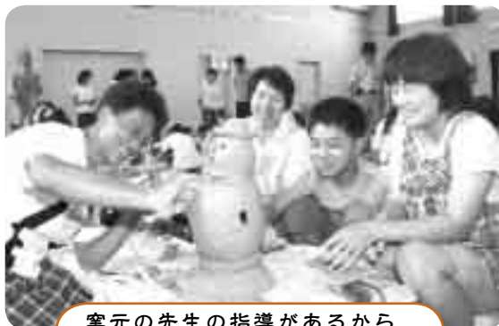
窯元の先生の指導があるから、初めての人も安心です！

申し込み ▶ 8月7日(火)〈必着〉までに、はがき(1組1枚)かファクス、Eメールに参加者全員の住所・氏名・年齢・電話番号、代表者に○、初参加の人は「初」と書いて、〒486-0913柏原町1-97-1、文化財課内、ハニワまつり実行委員会事務局(☎33-1113、FAX34-6484、Eメールbunkazai@city.kasugai.lg.jp)へ