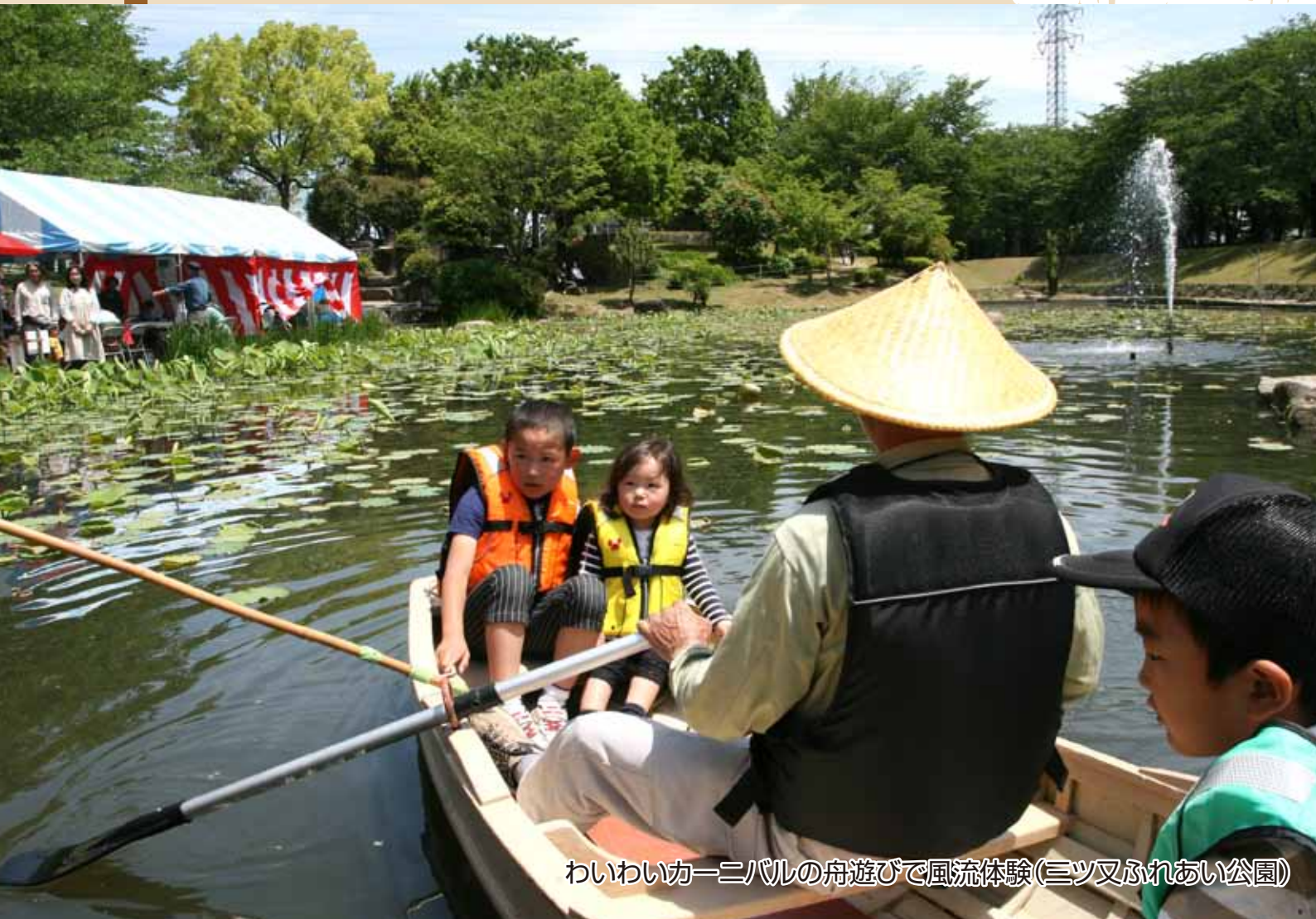
わいわいカーニバルの舟遊びで風流体験(三ツ又ふれあい公園)