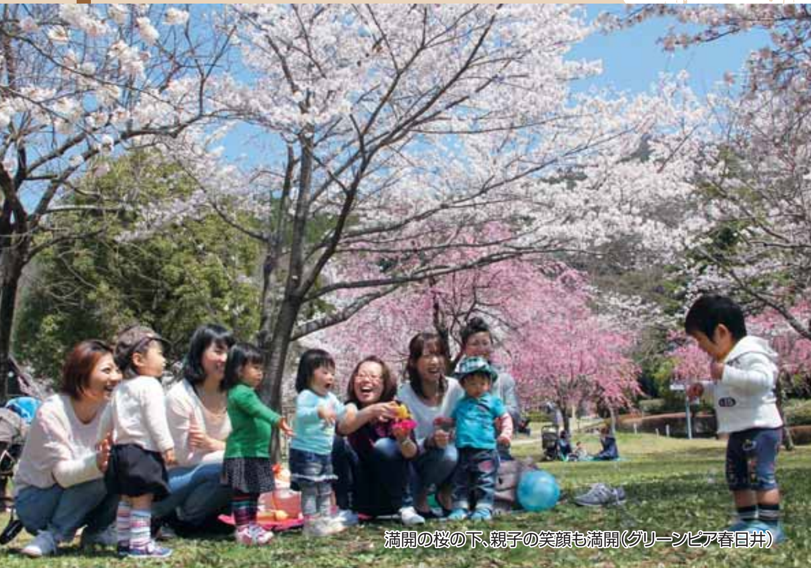
満開の桜の下、親子の笑顔も満開(グリーンピア春日井)