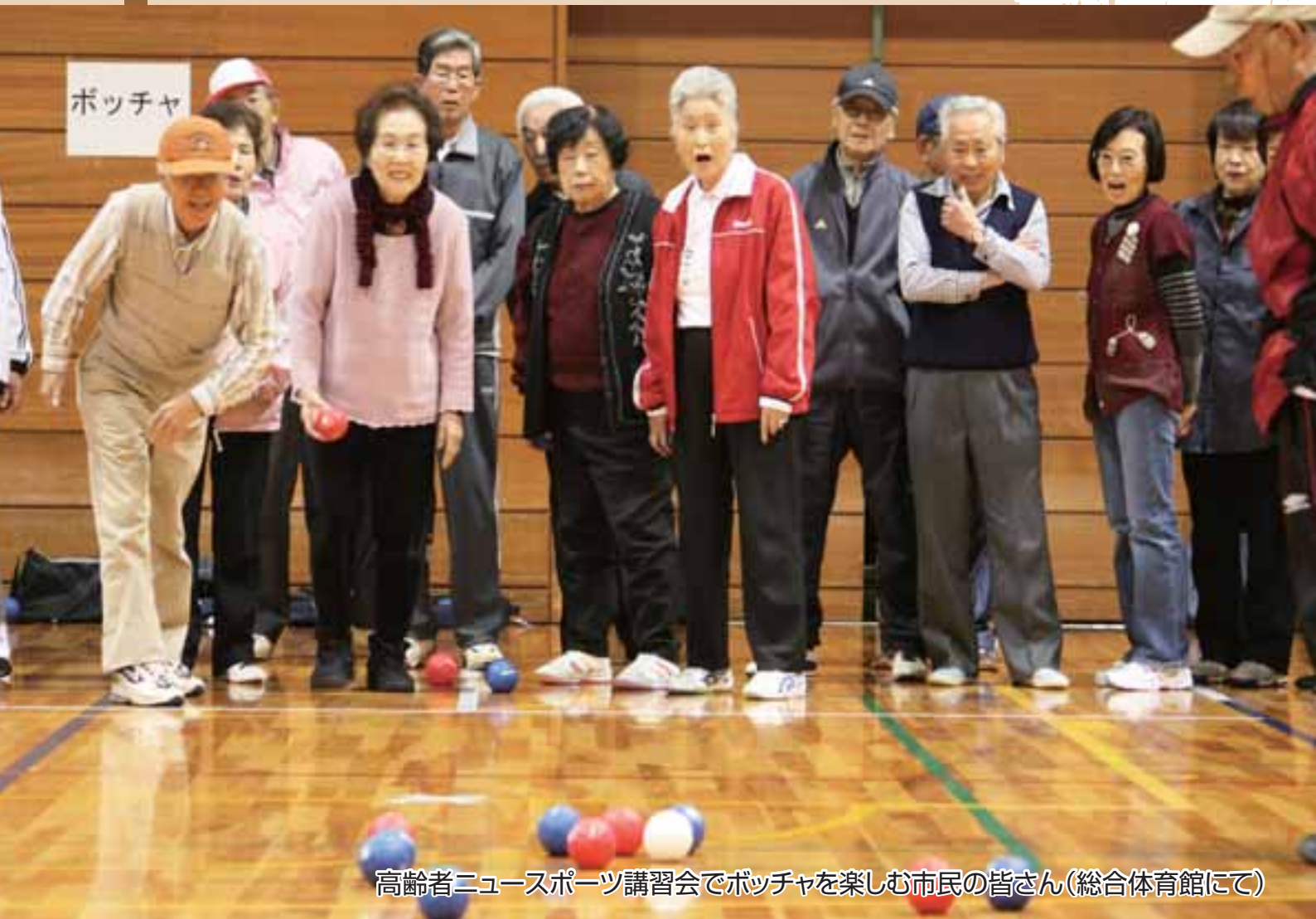
高齢者ニュースポーツ講習会でボッチャを楽しむ市民の皆さん(総合体育館にて)