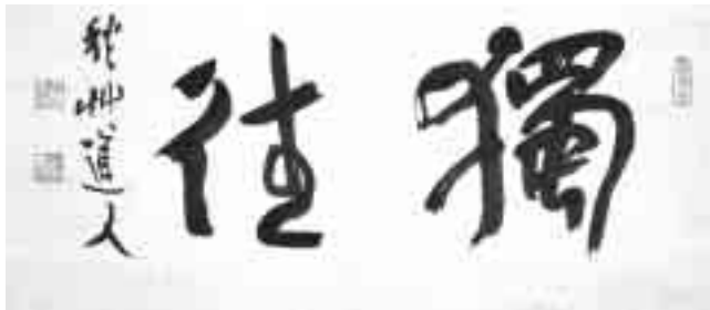
新潟市會津八一記念館蔵