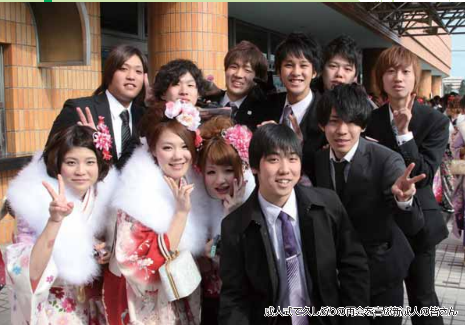
成人式で久しぶりの再会を喜ぶ新成人の皆さん