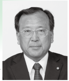
春日井市議会議長 丹羽 一正