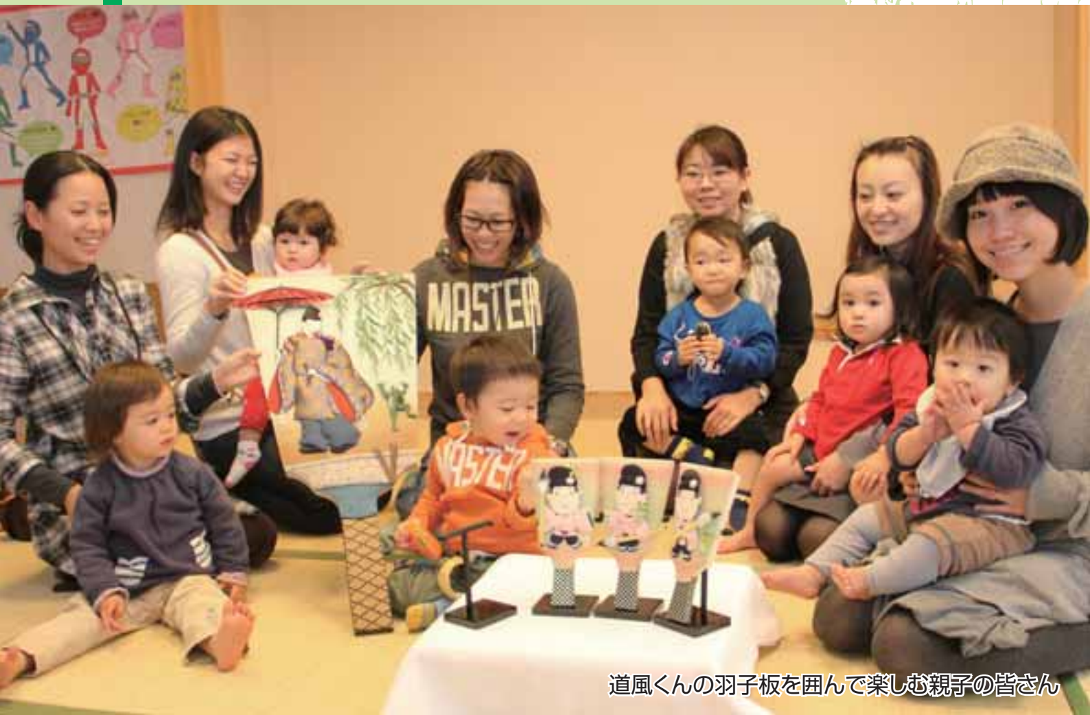
道風くんの羽子板を囲んで楽しむ親子の皆さん