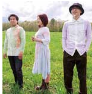
谷川俊太郎(撮影：深堀瑞穂) DiVa(撮影：深堀瑞穂)