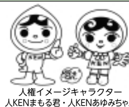
人権イメージキャラクター 人KENまるもる君・人KENあゆみちゃん

平成25年度の啓発活動重点目標は、「みんなで築こう人権の世紀～考えよう相手の気持ち 育てよう思いやりの心～」です。