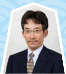
佐藤康光 棋士会会長