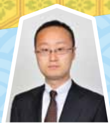
渡辺明竜王 (竜王・棋王・王将)