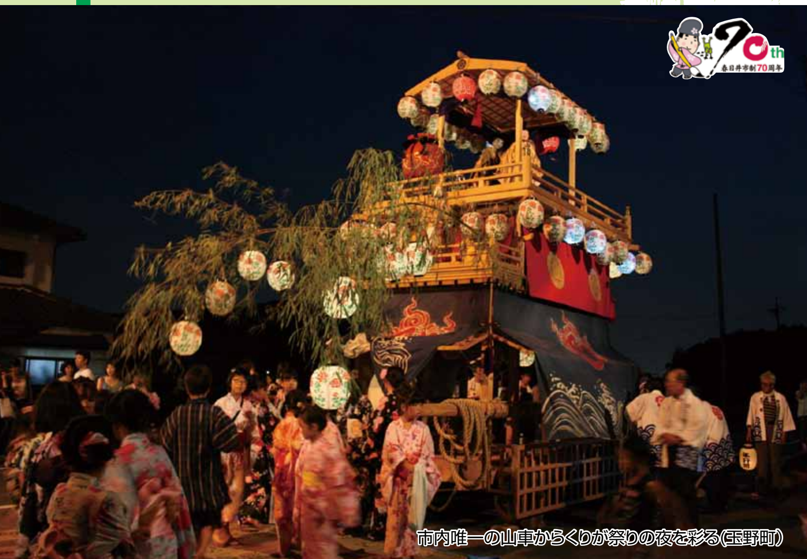
市内唯一の山車からくりが祭りの夜を彩る(玉野町)