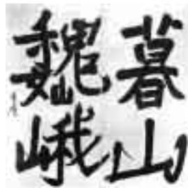
暮山巍峨(驥山館蔵)

昭和時代を代表する書家の一人。王羲之・王献之の書法を深く学んで、その点画の妙を生かした書を書き、さらに蘇軾をはじめとする宋代の書に傾倒した。やがてそれらの古典から離れて全く独自の書風を打ち立てる。高い技術に裏付けられ、気迫に満ちた書は、今も私たちに大きな感銘を与え続けている。