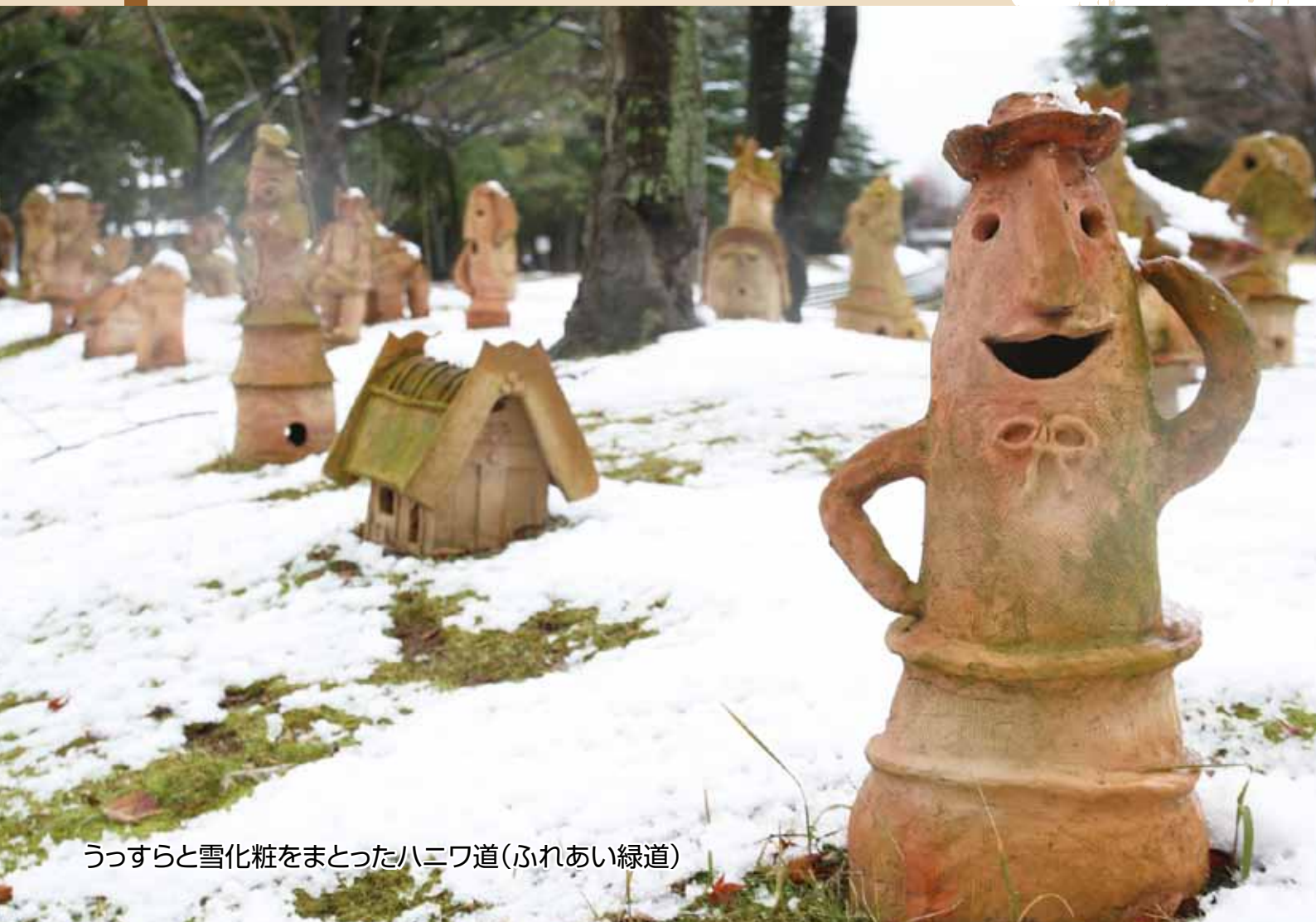
うっすらと雪化粧をまとったハニワ道(ふれあい緑道)