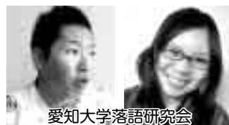
愛知大学落語研究会

入場券▶ 1月18日(金)から、東部市民センター、文化フォーラム春日井・文化情報プラザで販売