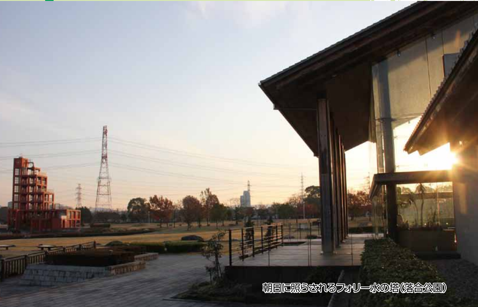
朝日に照らされるフォーリー水の塔(落合公園)