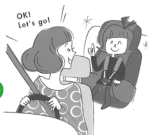
交通安全年間スローガン