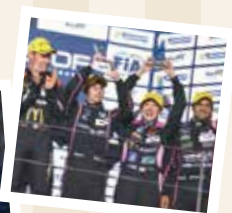
富士6時間耐久レースでは3位に