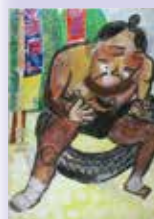
若田知里(白山小2) 「大和通 地蔵寺内 玉ノ井部屋 すもう のけいこ」