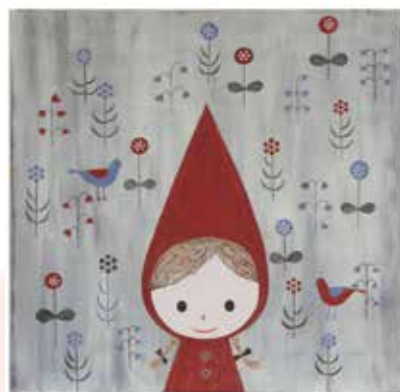
赤ずきん 花が咲いたよ(2011)

費 入場料一般500円、ペア券800円、前売り・中学生以下300円、障がい者手帳を持っている人とその介助者1人無料