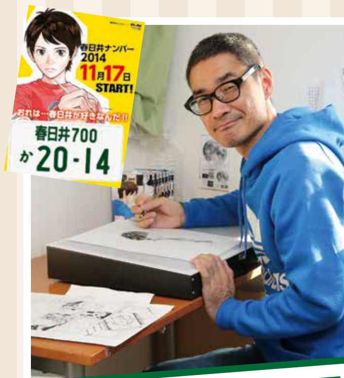
漫画家 Harold Sakuishi

思い入れのあるナンバーは？もし可能でしたら、大ヒット音楽漫画「BECK」にちなんで、曲のナンバーも教えてください。