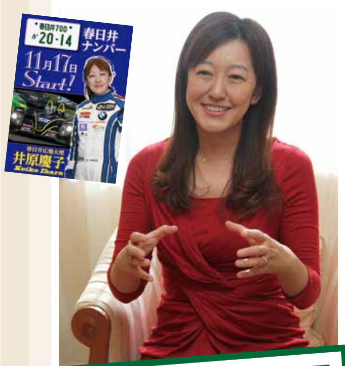
レーシングドライバー 井原慶子 KEIKO IHARA