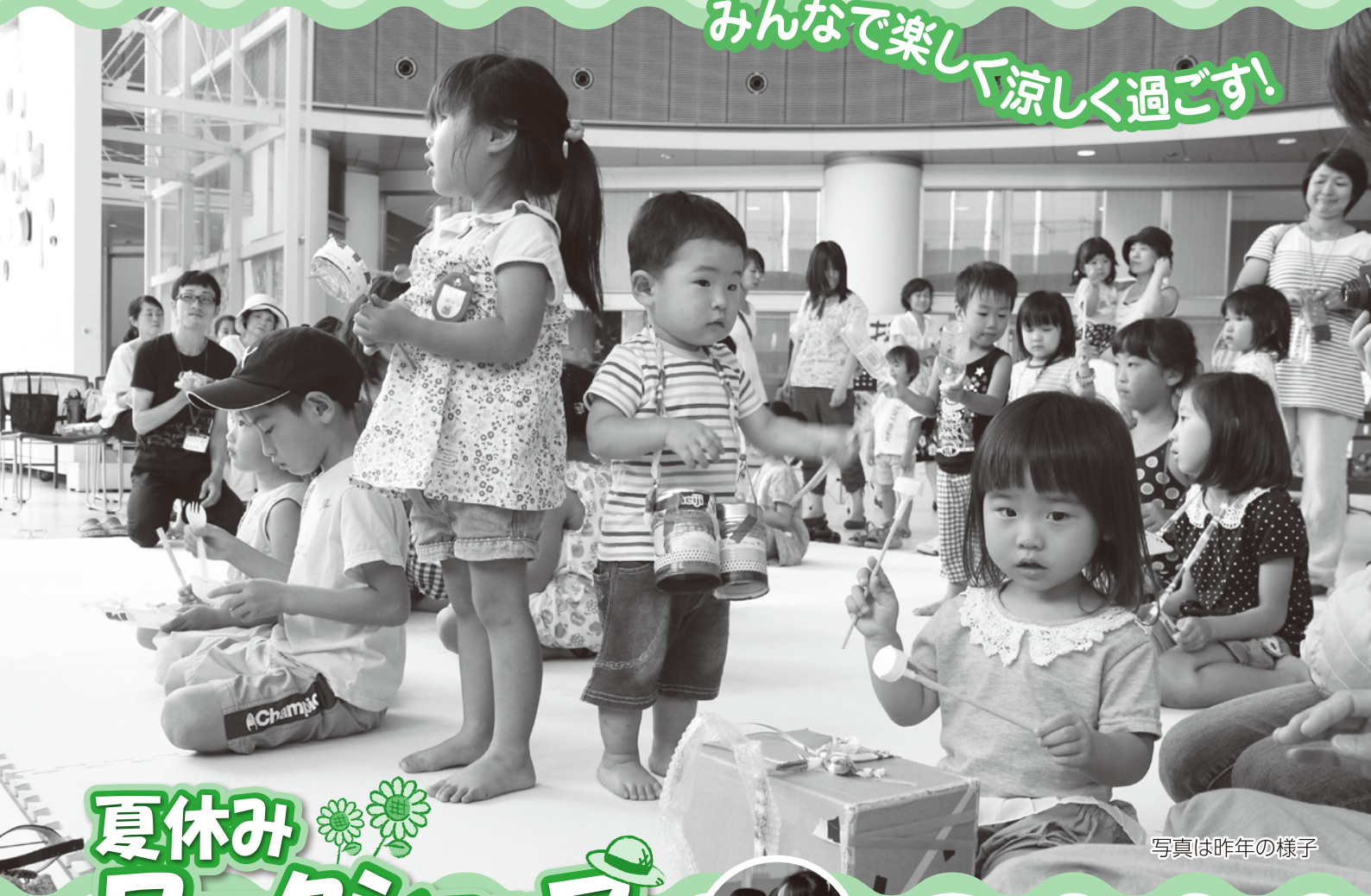
写真は昨年の様子