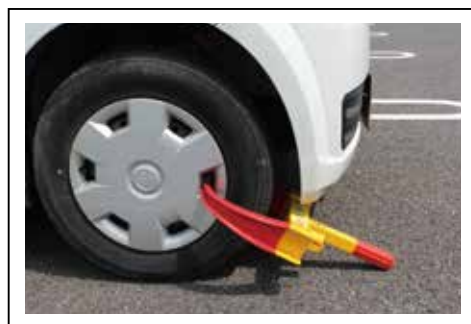
タイヤロックによる自動車の差し押さえ