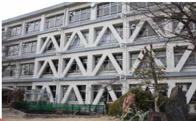
耐震補強を行った校舎

また、災害時の緊急輸送路を確保するため、橋りょうの耐震補強工事も進めていきます。