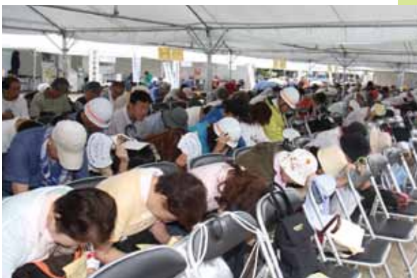
昨年8月の安全行動(シェイクアウト)訓練の様子

訓練に参加した人からは「災害時、急に行動するのは実際には難しい。訓練で事前に体験できてよかった」などの声が聞かれました。地震発生時には、まず、自分の身を自分で守ることが重要です。皆さんも、いざというときの行動を考えてみてください。