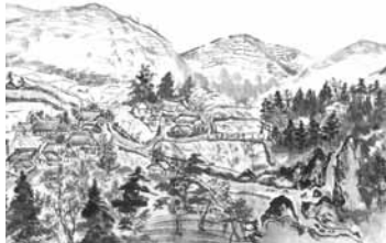
廻間町岩船神社付近(画:鈴木市重)

時 ①1月18日(土)～ 2月9日(日)〈月曜 日を除く〉午前9時 ～午後4時30分② 2月13日(木)～3 月2日(日)午前9時 ～午後5時