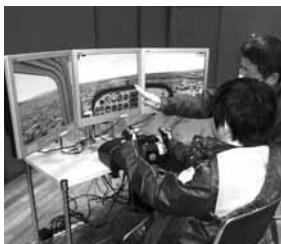
フライトシミュレーター

時 2月22日(土)午前10時～午後4時 場 豊山町社会教育センター(西春日井郡豊山町) 内 紙飛行機作りや航空宇宙に関する展示など