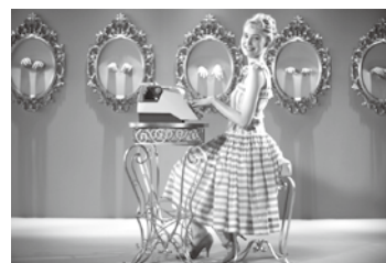
©2012 - copyright : Les Productions du Tresor - France 3 Cinema - France 2 Cinema - Mars Films - Wild Bunch - Panache Productions - La Cie Cinematographique - RTBF (Television belge) ©Photos - Jair Sfez.

入場券 ：文化フォーラム春日井で販売中 ※電話・メール予約もあり。詳しくはかすがい市民文化財団ホームページ( http://www.kasugai-bunka.jp )へ