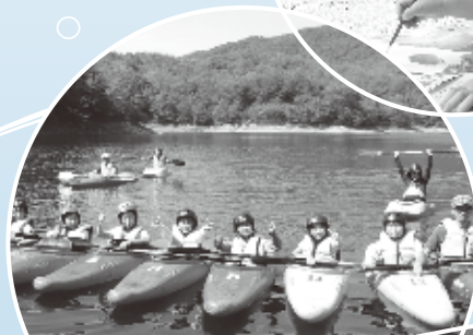
モットーカヌーを楽しもう! → P8