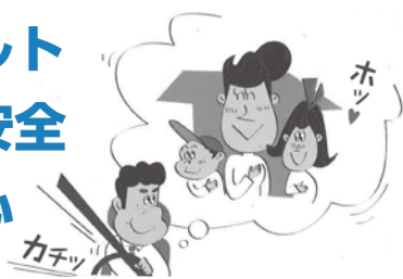
交通安全年間スローガン