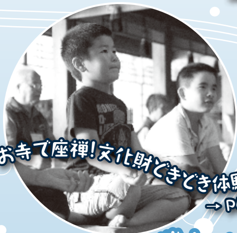
お寺で座禅!文化財ときどき体験! → P6