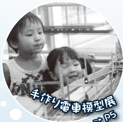
手作り電車模型展 → P5