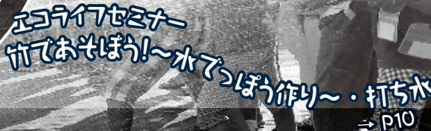
エコライフセミナー 竹であそぼう!~水でっぼう作り~・打ち水 → P10