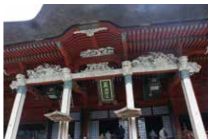
羽黒山 三神合祭殿