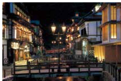
銀山温泉街(尾花沢市)

時 とき 場 場所 内 内容 講 講師 対 対象 定 定員 費 費用 持 持ち物 申 申し込み