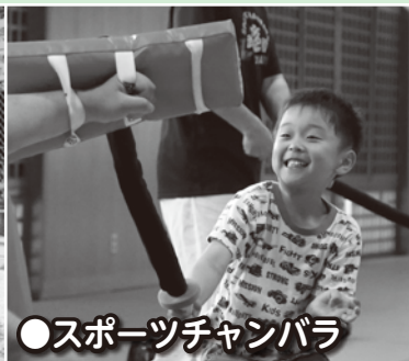
●スポーツチャンバラ