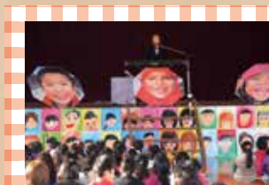
しおりさん（平成24年度） 春日井ギターオーケストラの皆さん（平成25年度）

子どもたちには多くの大人と触れ合い、その人たちの生き方、仕事、経験などをじかに聞くことで、生きていく力や知恵を身に付けてほしい、大きな希望を抱いて育ててほしいと願っています。