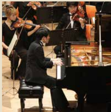
—昨年の「のだめカンタービレの音楽会」にて

また、市民主導でいろいろな活動をしていますねとも言われます。「のだめカンタービレの音楽会」発祥の地として、コンサートで作中の曲をリクエストされたこともありました。