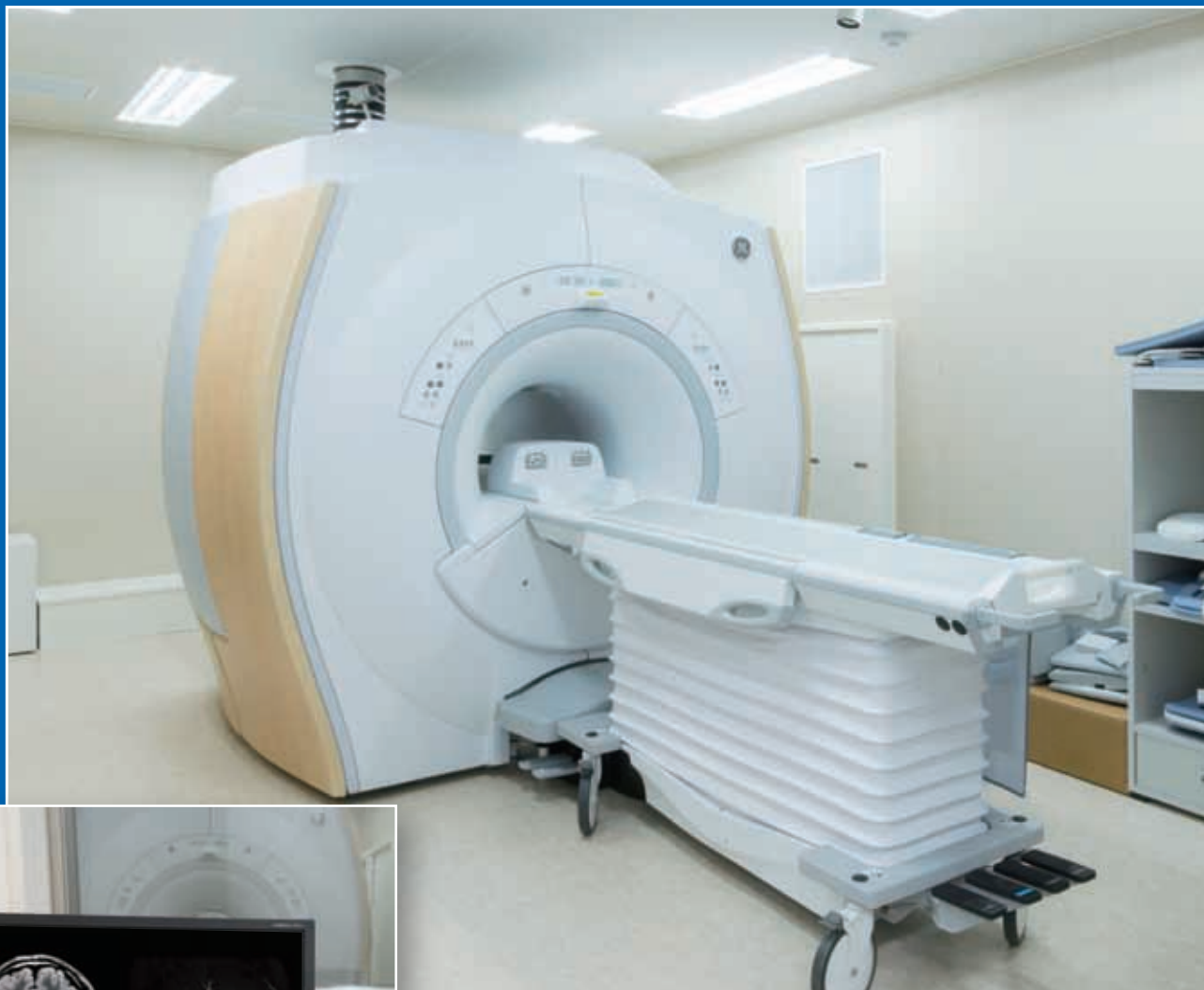
磁気共鳴画像診断装置 (MRI)

人間ドックや脳ドックをはじめとする各種の検査や健診を行い、生活習慣病の予防や早期発見など、受診者の皆様の健康管理に貢献します。