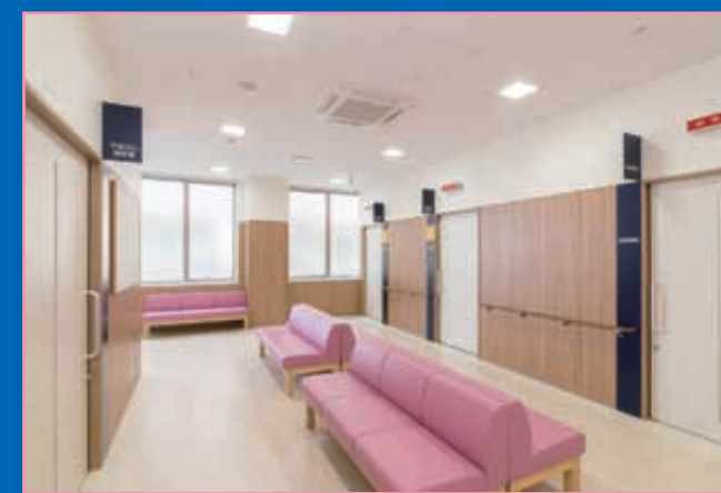
女性健診フロア待合