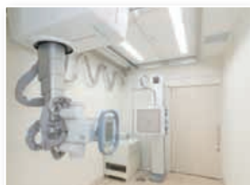
断層撮影(トモシンセシス)が可能な胸部X線撮影装置