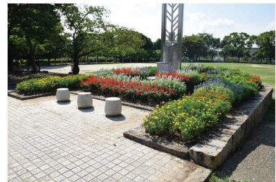
市民団体による植栽