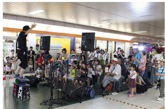
まちづくり団体によるイベント