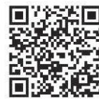
市ホームページ (ページ番号 1030663)

区・町内会・自治会への市からの回覧文書をホームページに掲載しておりますので、電子媒体等で回覧される場合にご活用ください。なお、文書の内容については各文書の担当課へお問い合わせください。